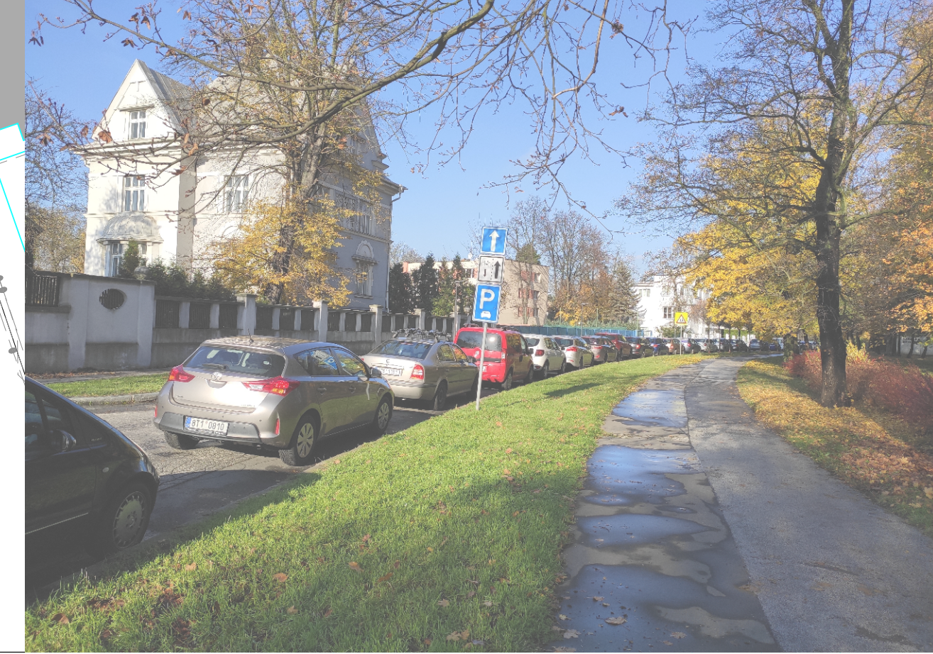
NAVRŽENÝ STAV - PO VYSADBĚ