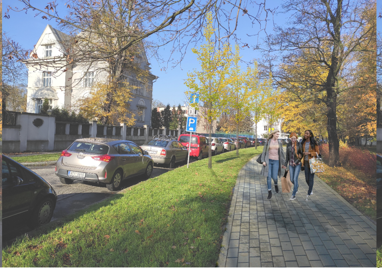
NAVRŽENÝ STAV - PO 30 LETECH